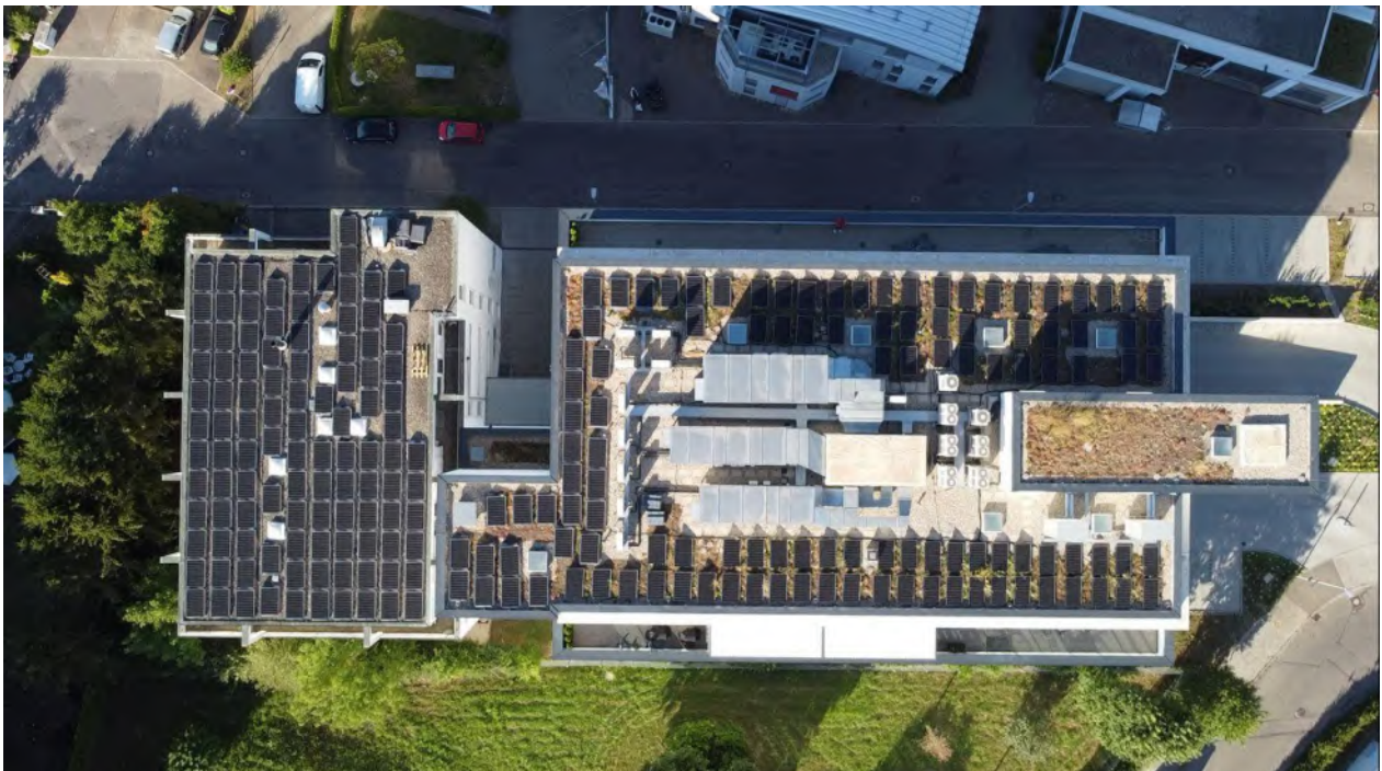
Abbildung: Bestandsgebäude (rechts) und Neubau (links), mit PV-Solaranlagen auf dem Flachdach.